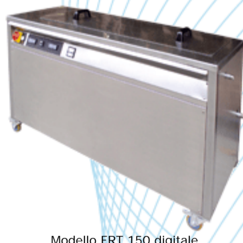
Modello FRT 150 digitale