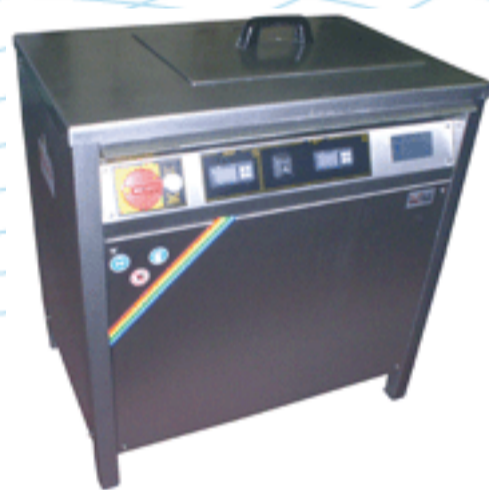
Modello FRT50 digitale