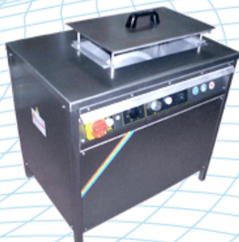
Modello FRT50 Special analogica